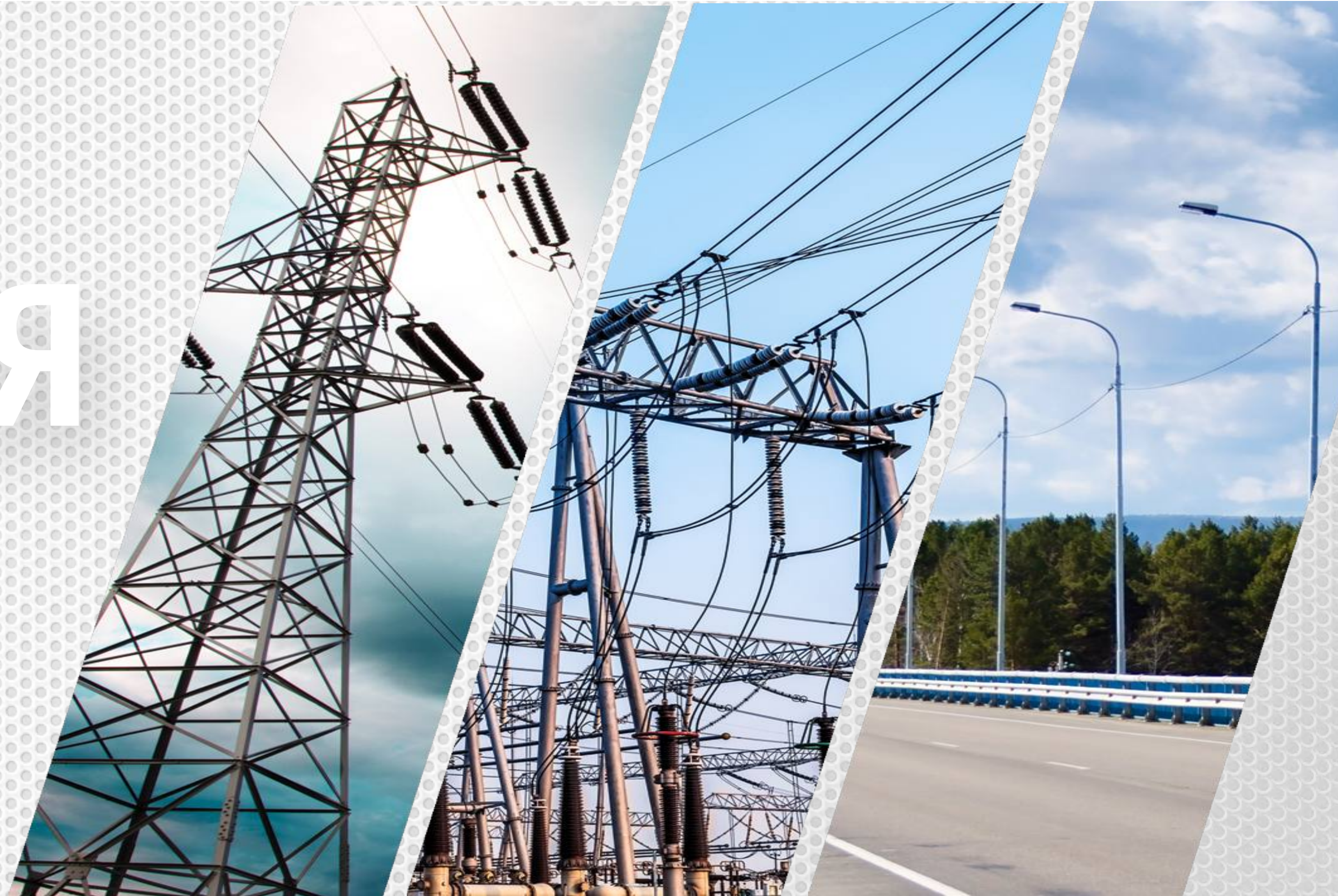
Высоковольтные линии электропередач