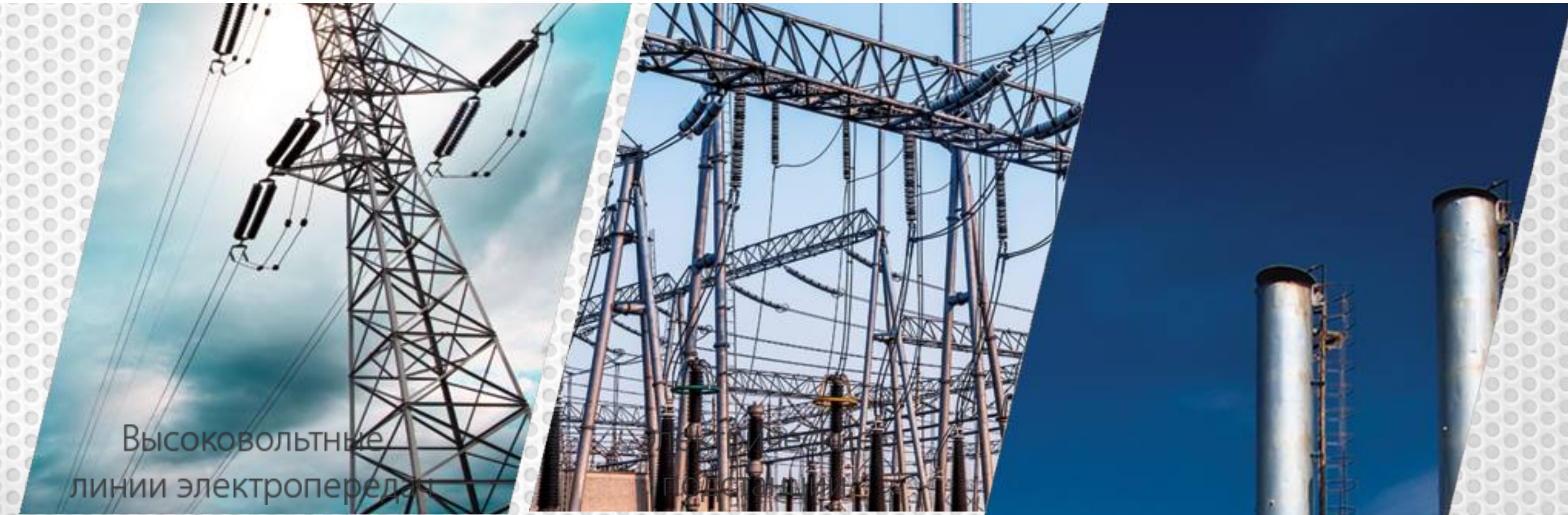
Высоковольтные линии электропередач