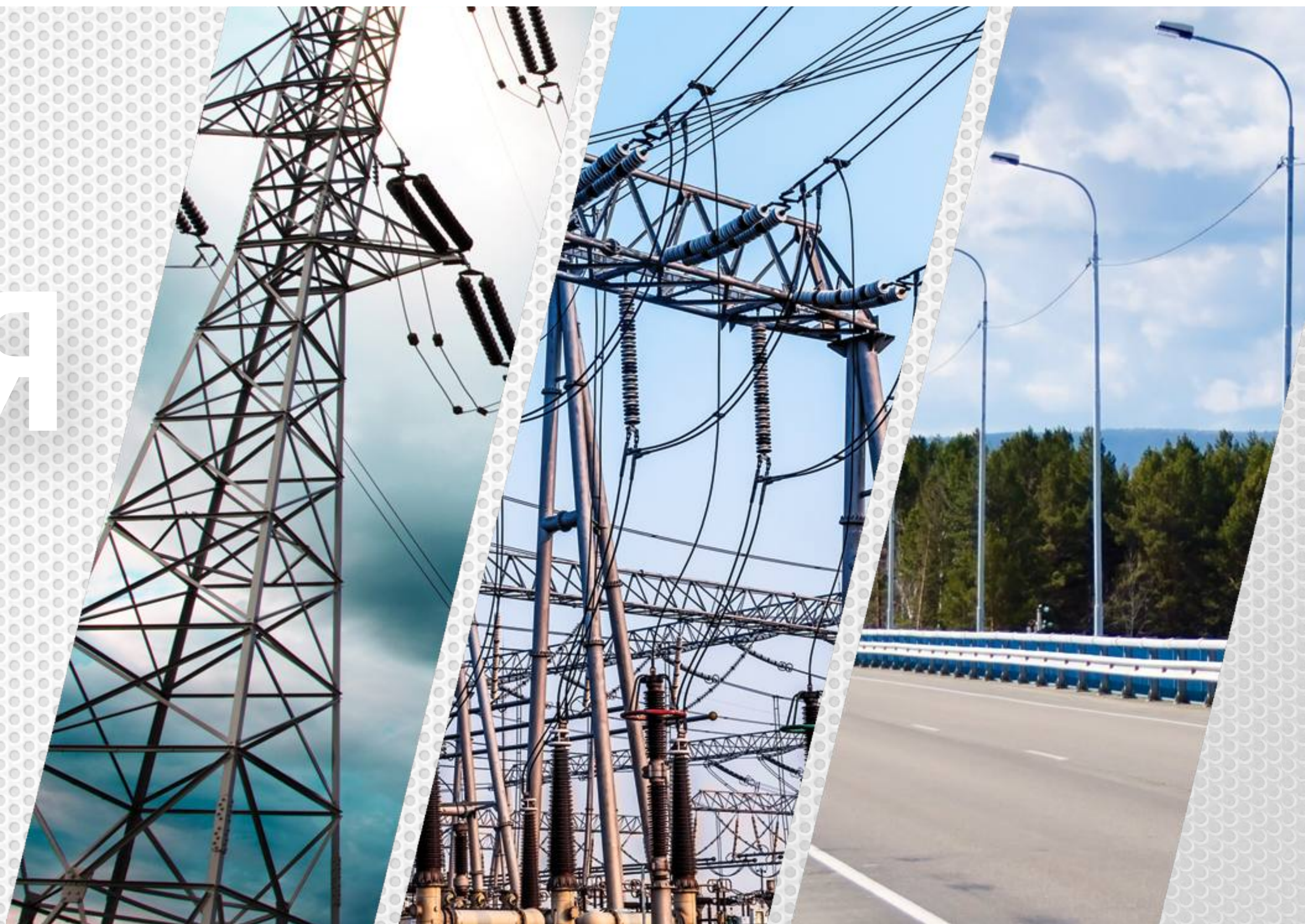
Высоковольтные линии электропередач